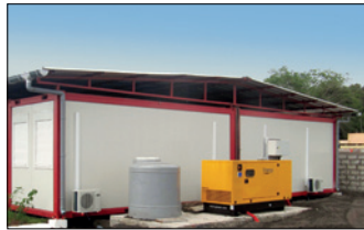
TOITURES À 2 PANS