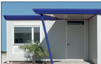
BANDEAUX ET AUVENTS